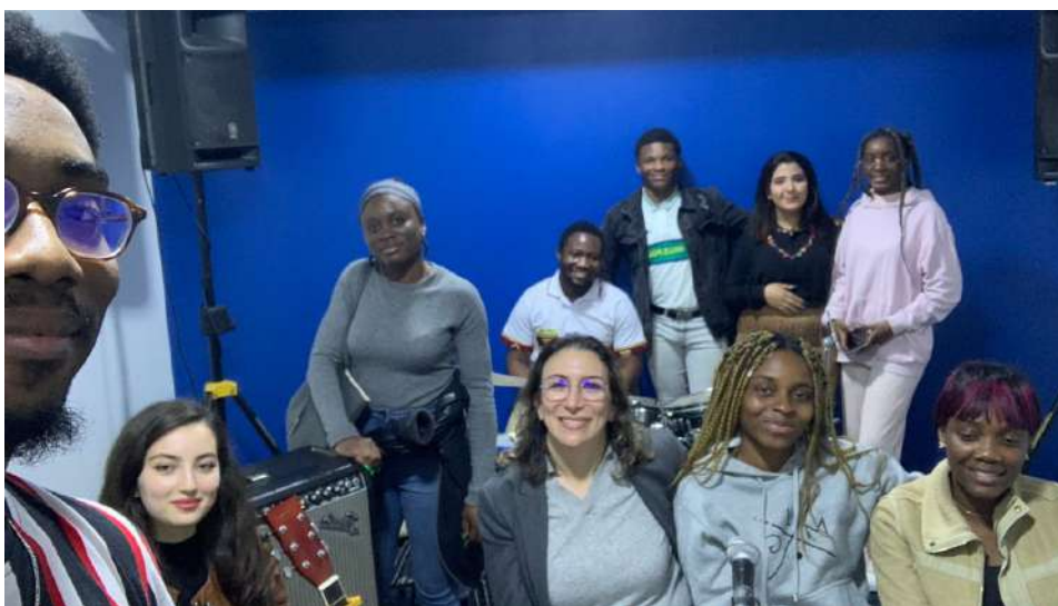
"La première du club de chant"

deux une prestation par semestre. Pour surenchérir sur l'activité des clubs nous vous informons que le club associatif organise une collecte de fond, de denrées alimentaires et de matériaux physiques qui seront distribués par la suite à un orphelinat. La date limite pour faire un don fera l'objet d'un communiqué ultérieure: tout de même gardons en mémoire que le don sera effectué durant le mois de mars.